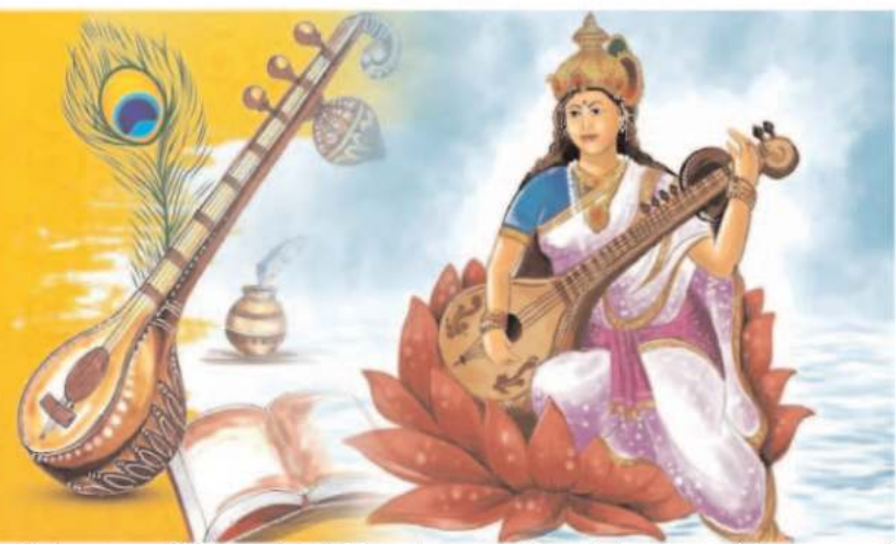
बच्चों को अक्षर ज्ञान भी दिया जाता है, जिसे 'विद्यारंभ' कहते हैं।

प्रकृति का उत्सव - बसंत पंचमी को वसंत ऋतु के