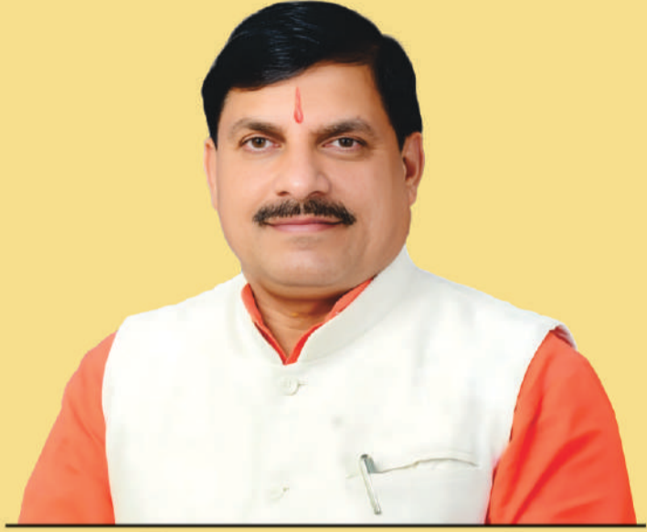
डॉ. मोहन यादव, मुख्यमंत्री