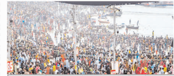
श्रद्धालुओं की संख्या 55 करोड़ के पार

प्रयागराज। संगमनगरी में 13 जनवरी से आयोजित हो रहा दिव्य-भव्य धार्मिक, सांस्कृतिक समागम महाकुंभ 2025 अब इतिहास रच चुका है। यहाँ अब तक 55 करोड़ से अधिक श्रद्धालुओं ने त्रिवेणी संगम में स्नान आस्था की पावन डुबकी लगाकर धार्मिक और सांस्कृतिक एकता की अद्वितीय मिसाल कायम की है। 55 करोड़ से अधिक की यह संख्या किसी भी धार्मिक, सांस्कृतिक या सामाजिक आयोजन में मानव इतिहास की अब तक की सबसे बड़ी सहाभागिता बन चुकी है। एक अनुमान के मुताबिक भारत में कुल 110 करोड़ सनातनी निवास करते हैं। इस लिहाज से महाकुंभ में देश की आधे सनातनी