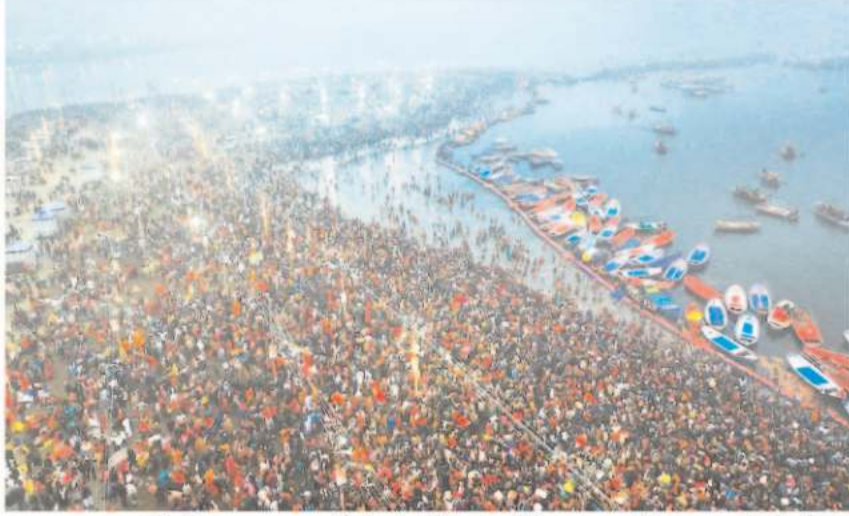
का पुण्य लाभ अर्जित किया।

प्रयागराज। आस्था के महापर्व महाकुंभ की शुरुआत आज से प्रयागराज में हो गई है। आज पौष पूर्णिमा का अमृत स्नान है। सुबह से ही श्रद्धालु गंगा, यमुना और अरुण सरस्वती नदी के संगम में डुबकी लगा रहे हैं। अनुमान था कि आज करीब 1 करोड़ श्रद्धालु संगम में डुबकी लगाएंगे लेकिन मुख्यमंत्री योगी आदित्यनाथ अपने ट्वीट में जानकारी दी कि आज डेढ़ करोड़ लोगों ने त्रिवेणी में स्नान का पुण्य लाभ अर्जित किया।