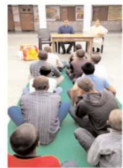
निरीक्षण किया था तथा बच्चों से संवाद करते हुए उनकी रूचि को भी जाना था। बच्चों ने कम्प्यूटर सीखने, पढ़ने तथा