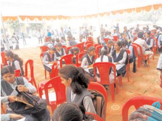
मेले जीएमसीसी इंडिया लिमि. फर्नीचर प्रा. लि. इंदौर में 15, द महसाणा फाटा अहमदनगर ई पाई डट काम (हावेल्स सोलर महाराष्ट्र में 8, बोनटन टेकनोमेक प्लांट) रीवा में 44, ग्रोफास्ट