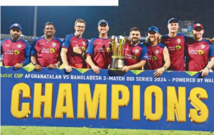
Salat CUP AFGHANATAN VS BANGLADESH 3-MATCH ODI SERIES 2024 - POWERED BY WAL