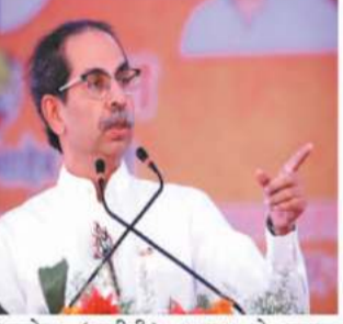
शिवसेना (यूबीटी) अध्यक्ष ने सवाल किया, 'जिस तरह से आपने मेरे बैग की जांच की, क्या इसी तरह से मोदी और शाह के बैग की जांच करेंगे?' उन्होंने जानना चाहा कि क्या मुख्यमंत्री एकनाथ शिंदे और उपमुख्यमंत्री अजित पवार तथा देवेंद्र फडणवीस के बैग की जांच नहीं की जानी चाहिए? ठाकरे ने कहा, 'ये सब अनावश्यक कार्य हो रहे हैं। मैं इसे लोकतांत्रिक नहीं मानता, यह लोकतंत्र नहीं हो सकता। लोकतंत्र में कोई बड़ा या छोटा नहीं होता।'

तो शिवसेना (यूबीटी) और विपक्षी एमवीए के कार्यकर्ता उनकी जांच करेंगे। ठाकरे ने कहा कि पुलिस और निर्वाचन आयोग को तब हस्तक्षेप नहीं करना चाहिए, क्योंकि मतदाताओं को भी अधिकार है कि जब वे (सत्तारूढ़ दलों के वरिष्ठ नेता) प्रचार के लिए आएं तो उनके बैग की जांच की जाए। इस बीच, शिवसेना (यूबीटी) ने सोशल मीडिया पर एक 'एक्स' के अपने आधिकारिक हैंडल से एक वीडियो साझा किया जिसमें ठाकरे के बैग की जांच होती दिखती है। वीडियो में ठाकरे को अधिकारियों से पूछते हुए सुना जा सकता है कि क्या उन्होंने किसी अन्य नेता के बैग की जांच की है। ठाकरे को उनसे पूछते सुना जा सकता है कि क्या उन्होंने मुख्यमंत्री शिंदे, फडणवीस, अजित पवार, प्रधानमंत्री मोदी और शाह के बैग की जांच की। जब अधिकारियों में से एक ने शिवसेना (यूबीटी) प्रमुख को बताया कि इन नेताओं ने अभी तक इस क्षेत्र का दौरा नहीं किया है, तो उन्होंने उनसे प्रधानमंत्री मोदी और शाह के बैग की जांच करने तथा उन्हें वीडियो रिकॉर्डिंग भेजने को कहा।