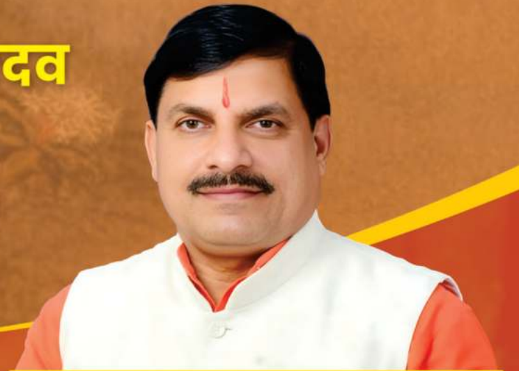
डॉ. मोहन यादव, मुख्यमंत्री