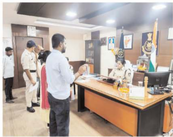
विभिन्न थाना क्षेत्रों से आए प्रत्येक आवेदकों से रू-ब-रू आवेदकों के द्वारा आवेदन पत्र होकर उनकी शिकायतों को समक्ष में प्रस्तुत किये गये, जिसे जनसुनवाई के माध्यम से