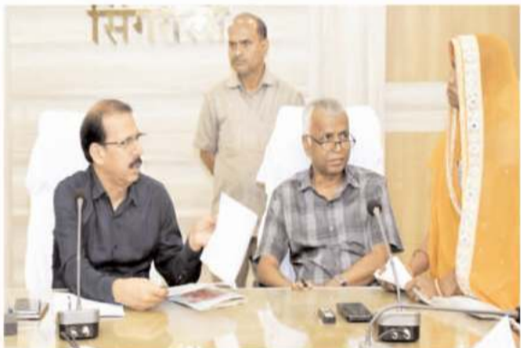
सिंगरौली। कलेक्टर चन्द्रशेखर शुक्ला के अध्यक्षता में कलेक्टर सभागार में आयोजित जन सुनवाई में जिले के विभिन्न अंचलो से आए 116 आवेदकों के द्वारा

अपनी समस्याओं से कलेक्टर को अवगत कराते हुये अपना आवेदन दिया गया। कलेक्टर श्री शुक्ला के द्वारा सभी आवेदकों से उनकी समस्याओं को सुनने के पश्चत जन