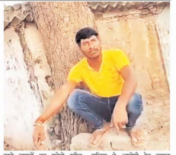
खड़े वाहनों का फोटो खींच वीडियो बना रहे थे तभी रेत से भरे डम्पर वाहन क्रमांक एमपी 53 जीए 1671 विकास ट्रांसपोर्ट विलॉजी के चालक ने मीडियाकर्मी पर भड़क अश्लील गालियां एवं वाहन से कुचलकर जान से मारने की धमकी देते हुये मोबाईल छिन्ने का हर सम्भव प्रयास किया। मीडियाकर्मी विरोध करने लगा तो वह और तैश में आ गया। इसकी लिखित शिकायत मीडियाकर्मी ने कोतवाली बैढ़न में किया। जहां

सिंगरौली। आज दिन मंगलवार को सुबह करीब 9 से 10 बजे के बीच एक मीडियाकर्मी ने इन्ट्री जोन में खड़े वाहनों का फोटो खींच वीडियो बना रहा था। तभी एक रेत से भरे चालक ने मीडियाकर्मी के साथ अश्रुल गालीगलौच कर जान से मारे की धमकी एवं मोबाईल लूटने का प्रयास करने लगा। जहां पीड़ित मीडियाकर्मी एसपी समेत अन्य पुलिस अधिकारियों को अवगत कराया। अंततः कोतवाली पुलिस ने फरियादी की रिपोर्ट पर डम्पर चालक के विरुद्ध अपराध पंजीबद्ध की है।