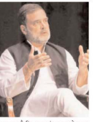
कहा जाता है कि आप संभल जाओ वरना आपका भी वही हाल होगा। माकन का कहना था कि भारत के अंदर अजय माकन ने मीडिया से कहा, हम सभी जानते हैं कि इंदिरा गांधी जी ने अपनी सीने पर 34 गोलीयां खाई थीं और शहीद हुईं थीं। राजीव गांधी ने शांति वार्ता शुरू की थी, इस वजह से उनके शरीर के चिथड़े उड़ गए। राहुल गांधी के परिवार ने देश के लिए शहदत दी और आज राहुल गांधी जो को यह

नई दिल्ली, एजेंसी। राहुल गांधी के खिलाफ आपत्तिजनक बयान देने वाले चार भाजपा नेताओं के खिलाफ कांग्रेस ने पुलिस में शिकायत दर्ज कराई है। जिन नेताओं के खिलाफ शिकायत दी गई है उनमें रेल राज्य मंत्री रवनीत सिंह बिट्टू भी शामिल हैं। कांग्रेस के कोषाध्यक्ष और पूर्व केंद्रीय मंत्री अजय माकन ने बुधवार सुबह दिल्ली के तुगलक रोड थाने में यह शिकायत दी है। उन्होंने आरोप लगाया है कि भारतीय जनता पार्टी के एक नेता ने दिल्ली में पिछले सप्ताह राहुल गांधी को जान से मारने की धमकी दी है। माकन के मुताबिक, भाजपा नेता ने कहा था कि राहुल गांधी संभल जाओ नहीं तो आपका भी वही हाल हुआ होगा जो आपकी दादी का हुआ था। तुगलक रोड पुलिस थाने के बाहर मौजूद अजय माकन ने मीडिया से कहा, हम सभी जानते हैं कि इंदिरा गांधी जी ने अपनी सीने पर 34 गोलीयां खाई थीं और शहीद हुईं थीं। राजीव गांधी ने शांति वार्ता शुरू की थी, इस वजह से उनके शरीर के चिथड़े उड़ गए। राहुल गांधी के परिवार ने देश के लिए शहदत दी और आज राहुल गांधी जो को यह