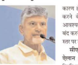
सहायता का अनुरोध : आंध्र प्रदेश के मुख्यमंत्री ने जोर देकर कहा कि वह केंद्र सरकार से वित्तीय सहायता का अनुरोध करने के लिए पत्र लिख रहे हैं। उन्होंने कहा, स्थिति में तत्काल हस्तक्षेप की आवश्यकता है और इन बाढ़ों के

से अधिक हो गया। यह उल्लंघन पिछली सरकार द्वारा रख-रखाव की कमी और बुधवार पर बढ़ते अतिक्रमण के कारण हुआ। सत्ता संभालने के 100 दिनों के भीतर, यह बड़ी आपदा सामने आई। स्थिति को नियंत्रण में लाने में 10 दिन लगे। अगर जगन जैसा कोई व्यक्ति सत्ता नहीं होता, तो इतने छह महीने लग जाते। इस दौरान उन्होंने इस बात पर भी प्रकाश डाला कि पिछली सरकार ने पंचायत राज विभाग से धन का दुरुपयोग किया और प्राकृतिक आपदा निधि का लेखा-जोखा देने में विफल रहे।