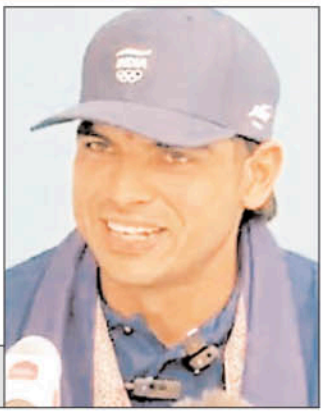
चोट के साथ ओलंपिक में खेले नीरज चौपड़ा