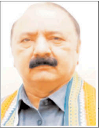
लोकसभा में नये सांसदों के लिए प्रबोधन कार्यक्रम