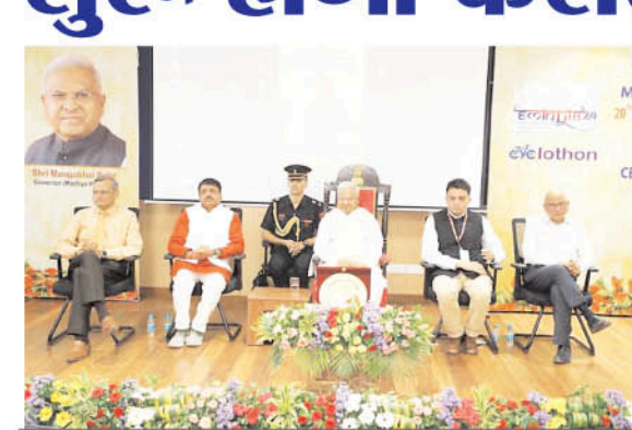
5 दिवसीय ईएमईडिया-24 के समापन में पहुंचे राज्यपाल

भोपाल। एम्स भोपाल में आयोजित 20वें अखिल भारतीय आपातकालीन चिकित्सा सम्मेलन (ईएमईडिया-24) का रविवार 11 अगस्त को भव्य समापन हुआ। पांच दिन चले इस सम्मेलन के अंतिम दिन एक बेसिक लाइफ सपोर्ट और सीपीआर कोर्स का उद्घाटन मध्य प्रदेश के राज्यपाल मंगू भाई पटेल ने किया। इस अवसर पर सांसद आलोक शर्मा भी मौजूद रहे। राज्यपाल, मंगू भाई पटेल ने कहा कि आपातकालीन चिकित्सा स्वास्थ्य सेवा का एक ऐसा क्षेत्र है, जो हर पल चुनौती पूर्ण होता है, चाहे वह दुर्घटनाएं हो प्राकृतिक आपदाएं हो या फिर अन्य आपातकालीन स्थितियां। इन सभी में त्वरित और सटीक चिकित्सा सेवा प्रदान करना अत्यंत आवश्यक है। इस क्षेत्र में नवीनतम तकनीक और प्रोटोकॉल का उपयोग करके हम कई जीवन