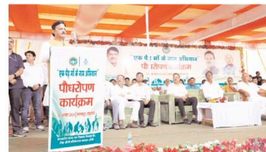
छाया के साथ-साथ प्राणवायु देते हैं। वन विकास निगम बंधाई का पात्र है जिन्होंने 22 हजार एकड़ पठारी क्षेत्र में वर्ष 2010 से अब तक 85 लाख से अधिक पौधे लगाए हैं। आगामी तीन वर्षों में इस कार्यक्रम को आगे बढ़ाते हुए लगभग 15 लाख पौधों का पौधरोपण किया जाएगा। इस तरह इस बंजर भूमि में 1.25 करोड़ पौधे लगाकर हरा-भरा किया जाएगा। उन्होंने कहा कि पूर्व में लगाए गए पौधों में से 80 प्रतिशत से अधिक पौधे जीवित हैं। इस कार्यक्रम की पूर्णता के अवसर पर 2027 में भव्य कार्यक्रम का आयोजन भी किया जाएगा। उन्होंने कहा कि वह स्वयं भी पूर्व विधानसभा अध्यक्ष श्री गिरीश गौतम के साथ हवाई सर्वे कर इस क्षेत्र की हरीतिमा का अवलोकन करेंगे। अपने उद्घोषण में श्री शुक्ल

रीवा। उप मुख्यमंत्री श्री राजेन्द्र शुक्ल ने कहा है कि मऊगंज जिले के देवतालाब विधानसभा क्षेत्र अन्तर्गत ग्राम मलकपुर की बंजर जमीन को हरा-भरा बनाकर आने वाली पीढ़ी को सौगात के रूप में सौंपा जाएगा। पुराने जमाने के जो जंगल नष्ट हो गए और जमीन बंजर हो गई वहाँ सघन वृक्षारोपण कर पूर्व की तरह ही हरा-भरा जंगल बनाकर आने वाली पीढ़ी को सौंपा जाएगा। श्री शुक्ल वन विकास निगम द्वारा साढ़े चार लाख पौधों के वृक्षारोपण कार्यक्रम में शामिल हुए। उन्होंने एक पेड़ माँ के नाम अभियान के तहत पौधरोपण किया। इस अवसर पर श्री शुक्ल ने कहा कि वृक्षारोपण का कार्य पुनीत कार्य है। वृक्ष हमें फल,