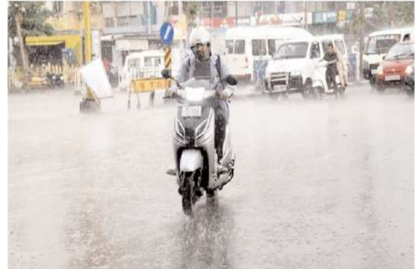
अगले दो दिन तक तेज बारिश का अलर्ट

आंकड़ा 25.4 इंच तक पहुंच गया। पिछले 24 घंटे के दौरान प्रदेश के उज्जैन संभाग के जिलों में कुछ स्थानों पर भोपाल, इंदौर, चंबल संभागों के जिलों में अनेक स्थानों पर नर्मदापुरम, ग्वालियर, रीवा, जबलपुर, शहडोल, सागर संभागों के जिलों में अधिकांश स्थानों पर वर्षा दर्ज की गई एवं शेष सभी संभागों के जिलों में मौसम शुष्क रहा। अधिकतम तापमान भोपाल, नर्मदापुरम संभागों के जिलों में काफी गिरे एवं शेष सभी संभागों के जिलों के तापमानों में विशेष परिवर्तन नहीं हुआ। ग्वालियर संभाग के जिलों में सामान्य से काफी कम रहे। नर्मदापुरम, रीवा, जबलपुर, सागर संभागों के जिलों में सामान्य से कम रहे एवं शेष सभी संभागों के जिलों में सामान्य रहे न्यूनतम तापमानों में सभी संभागों के जिलों में विशेष परिवर्तन नहीं हुआ। वे शेष सभी संभागों के जिलों में सामान्य रहे।