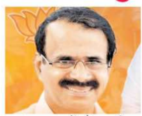
भाजपा सूत्रों के मुताबिक, कुरियन को यदि किसी कारण से मध्यप्रदेश से नहीं भेजा गया तो पंजाब से केंद्रीय मंत्री रवनीत सिंह बिट्टू को भी राज्यसभा भेजा जा सकता है। इस सीट पर पूर्व सांसद केपी यादव का नाम भी लिया जा

भोपाल। केंद्रीय मंत्री ज्योतिरादित्य सिंधिया के लोकसभा जाने से उनकी राज्यसभा सीट खाली हो गई है। इसके लिए तीन सितंबर को मतदान होगा। नामांकन का अंतिम दिन बुधवार यानी 21 अगस्त है। भाजपा की ओर से केंद्रीय मंत्री जॉर्ज कुरियन का नाम तय हो गया है। इसकी औपचारिक घोषणा भी कर दी गई है। यदि कांग्रेस ने उम्मीदवार नहीं उतारा तो कुरियन के राज्यसभा जाने में कोई अड़चन नहीं रह जाएगा।