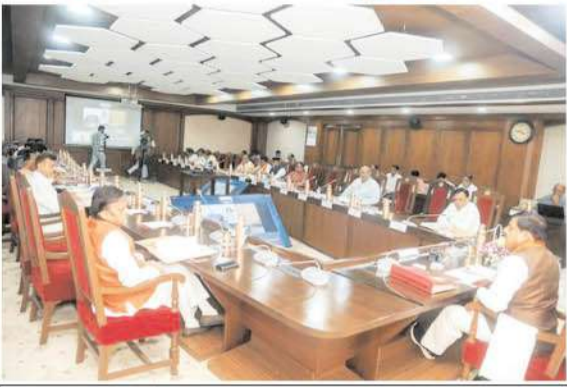
मुख्यमंत्री डॉ. यादव की अध्यक्षता में मंत्रि-परिषद् के निर्णय

भोपाल। मुख्यमंत्री डॉ. मोहन यादव की अध्यक्षता में मंत्रि-परिषद् की बैठक मंत्रालय में हुई। मंत्रि-परिषद् द्वारा सिंगरौली जिले की चितरंगी दाबयुक्त सूक्ष्म सिंचाई परियोजना के लिये 1320.14 करोड़ रुपये (सैंच्य क्षेत्र 32,125 हेक्टेयर) की प्रशासकीय स्वीकृति प्रदान की गई है। स्वीकृत परियोजना से सिंगरौली जिले की चितरंगी तहसील के 132 ग्राम (सैंच्य क्षेत्र 28,192 हेक्टेयर) एवं देवसर तहसील के 10 ग्राम (सैंच्य क्षेत्र 3,933 हेक्टेयर) लाभांशित होंगे।