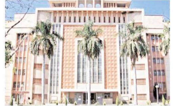
समन और वारंट जारी किए जा सकेंगे। ई-मेल के जरिए भेजे गए समन और वारंट की तामील तब मानी जाएगी, जब ई-मेल बाउंस बैंक नहीं होता। इसका मतलब है कि अगर ई-मेल डिलीवर हो जाता

भोपाल। मध्यप्रदेश में न्यायिक प्रक्रिया को और अधिक सुगम और प्रभावी बनाने के लिए एक नया नियम लागू किया गया है। इस नियम के तहत अपराध और वारंट ऑनलाइन माध्यमों जैसे क्लॉटसएफ, ई-मेल, और टेक्स्ट मैसेज के जरिए भेजे जाएंगे और उन्हें तामील माना जाएगा। इस नई पहल के साथ मध्यप्रदेश ऐसा करने वाला देश का पहला राज्य बन गया है। इसको लेकर गृह विभाग ने नोटिफिकेशन जारी कर दिया है। बता दें मध्यप्रदेश सरकार ने नए कानून के लिए डेढ़ महीने में यह नियम तैयार किया है, जिसके अनुसार अब कोर्ट से सीधे