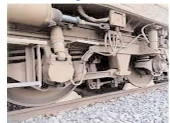
महाकुंभ में रेलवे ने 900 स्पेशल ट्रेन चलाने की तैयारी की है। महाकुंभ में नियमित रूप से रेलवे की ओर से पेट्रोलिंग की जाएगी। इसके साथ-साथ जो विभिन्न सुरक्षा एजेंसियां हैं वह भी अलर्ट मोड में रहेगी, ताकि रेलवे ट्रैक को लेकर होने वाले हादसों को रोका जा सके। महाकुंभ में 30 करोड़ से

प्रयागराज। भारतीय रेलवे प्रयागराज महाकुंभ 2025 की तैयारियों में जुट गया है। इसी को देखते हुए रेलवे उत्तर प्रदेश के लिए 900 स्पेशल ट्रेन चलाने की योजना बना रहा है। इस संदर्भ में रेलवे बोर्ड की चेयरमैन और सीईओ जया वर्मा सिन्हा ने बड़ी जानकारी साझा की है। जय वर्मा का कहना है कि, स्पेशल ट्रेन चलाने के साथ ही प्रयागराज जिले के आसपास के 9 स्टेशनों के इंफ्रास्ट्रक्चर फोकस किया जा रहा है। रेलवे बोर्ड की चेयरमैन और सीईओ जया वर्मा सिन्हा ने कहा कि, जनवरी 2025 में आयोजित होने वाले महाकुंभ के लिए रेलवे पूरी तरह से तैयार है। 2019 में आयोजित हुए कुंभ मेले में जहां 530 स्पेशल ट्रेनें रेलवे की ओर से चलाई गई थीं। वहीं वर्ष 2025 के