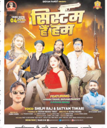
खाशियत है कि यह न केवल अपने आधुनिक संगीत और वात्सल्यपूर्ण बोलों के लिए जाना जा रहा है, बल्कि मुख्य युवा कलाकारों की शानदार प्रस्तुति के लिए भी जाना जा रहा है। इस एल्बम के रिलीजिंग के बाद युवाओं में काफी उत्साह देखने को