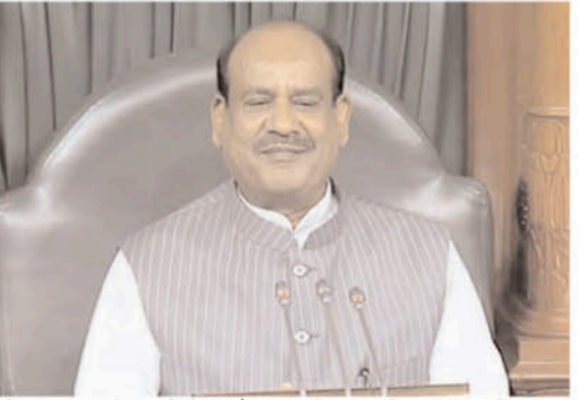
बनेगा। जहां गंभीर बहसें होंगी और शासकीय काम के साथ विमर्शों का नया आकाश खुलेगा।

राजस्थान के कोटा जिले में 23 नवंबर, 1962 को जन्में ओम बिरला का समूचा राजनीतिक और सांख्यिक जीवन सेवा, समर्पण और उससे उपजी सफलताओं से बना है। भारतीय जनता युवा मोर्चा के जिलाध्यक्ष के रूप में काम प्रारंभ कर वे राजस्थान में युवा मोर्चा के प्रदेश अध्यक्ष, राष्ट्रीय उपाध्यक्ष बने। ओम बिरला में ऐसा क्या है जो उन्हें लगातार दूसरी बार लोकसभा के अध्यक्ष जैसी बड़ी जिम्मेदारी पर पहुंचाता है। अपने कोटा शहर में जरूरतमंद लोगों को कपड़े, दवाएं, भोजन पहुंचाते-पहुंचाते बिरला कब राष्ट्रीय राजनीति के सितारे बन गए, यह एक अद्भुत कहानी है। प्रधानमंत्री ने सदन में उनके द्वारा चलाए जा रहे अनेक सामाजिक कार्यों की चर्चा की। उनकी सरलता, सहजता और सदन चलाने की उनकी क्षमताएं प्रमाणित हैं। अब जब वे ध्वनिमत से लोकसभा के अध्यक्ष चुने जा चुके हैं, तब उन पर बहुत बड़ी जिम्मेदारी आन पड़ी है। यह भी शुभ रखा कि कांग्रेस ने प्रारंभिक चर्चाओं के बाद भी मत विभाजन की मांग नहीं की और उनका चयन सर्वसम्मत से हुआ। इससे संसद की गरिमा बनी और परंपराओं का पालन हुआ है। उम्मीद की जानी चाहिए आने वाले समय में लोकसभा ज्यादा बेहतर तरीके से अपने कामों को अंजाम दे सकेगी। श्री बलराम जाखड़ के बाद वे दूसरे ऐसे सांसद हैं, जिन्होंने यह गरिमामय पद दुबारा संभाला है। इस बात को रेखांकित करते हुए प्रधानमंत्री ने अपने भाषण में कहा कि नए सांसदों को बिरला से सीखना चाहिए। मोदी ने कहा कि संसद 140 करोड़ देशवासियों की आशा का केंद्र है। सदन में आचरण और नियमों का पालन जरूरी है। सदन की गरिमा और परंपराओं का पालन अध्यक्ष को बहुत महती जिम्मेदारी है। उम्मीद की जानी चाहिए कि संसद में लोकसभा अध्यक्ष के रूप में बिरला जी का यह कार्यकाल उदाहरण