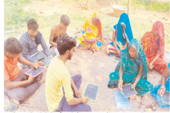
कार्यक्रम की गतिविधियाँ जारी हैं। नव साक्षरों को साक्षर करने के लिए सभी विकासखण्डों में