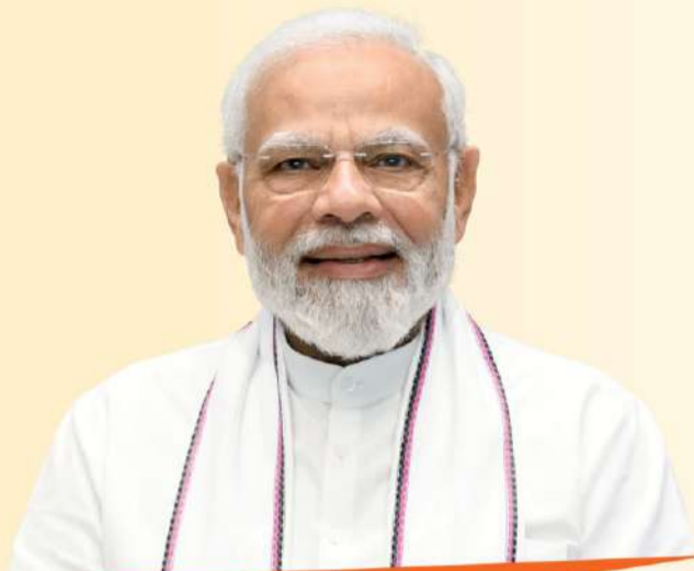
Narendra Modi Prime Minister