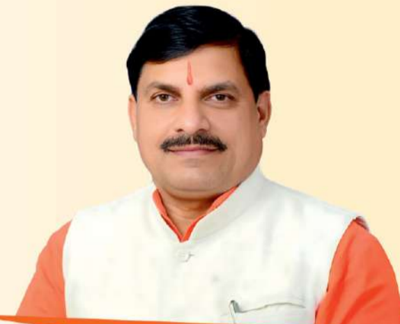
Dr. Mohan Yadav Chief Minister