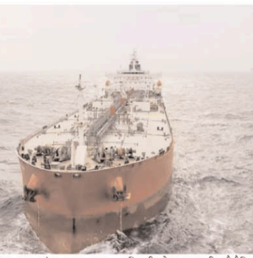
लाइबेरिया का झंडा लगा था। पश्चिमी नेतृत्व वाली नौसैनिक संयुक्त समुद्री सूचना केंद्र टास्क फोर्स के साथ काम कर रहा है। उन्होंने बताया कि जहाज को

हमला यमनी के होदेदा शहर से 120 किमी पश्चिम की तरफ किया गया है। एजेंसी ने बताया कि व्यापारिक जहाज के मास्टर ने अनकरूड एरियल सिस्टम (यूपएस) की चपेट में आने की रिपोर्ट दी, जिसमें जहाज को नुकसान पहुंचा। उन्होंने आगे कहा, जहाज अपने अगले बंदरगाह की तरफ बढ़ रहा है। इस हमले में किसी के हताहत होने की खबर नहीं है। अधिकारी हमले की जांच कर रहे हैं। ब्रिटिश समुद्री सुरक्षा फर्म एंबे ने बताया कि ग्रीस के जहाज में