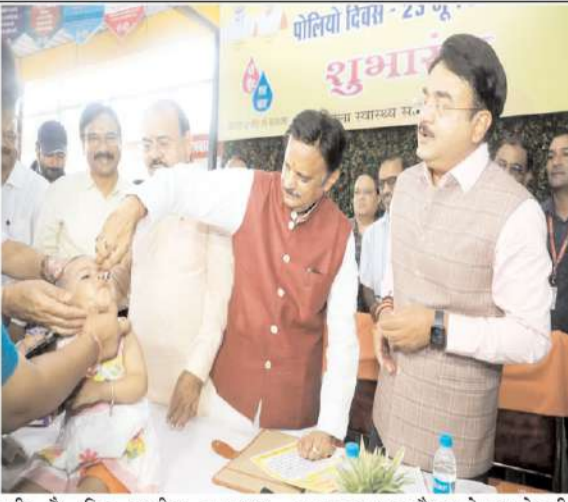
उप मुख्यमंत्री श्री राजेंद्र शुक्ल ने जिला शीघ्र हस्तक्षेप इकाई (जयप्रकाश चिकित्सालय परिसर) भोपाल में पोलियो ड्रॉप पिलाकर मध्यप्रदेश में राष्ट्रीय पल्स पोलियो अभियान का शुभारंभ किया।

संकल्प दिलाया। उप मुख्यमंत्री ने कहा कि 25 जून से प्रदेश में दस्तक अभियान शुरू किया जा रहा है। इस अभियान में स्वास्थ्य विभाग का अमला घर-घर जाकर दस्तक देगा। अभियान में बच्चों की वैक्सिनेशन के साथ-साथ अन्य जाँच भी की जाएगी और आवश्यकतानुसार उपचार के व्यवस्था की जाएगी। उप मुख्यमंत्री ने कहा कि स्वस्थ और सशक्त भारत के निर्माण में सभी नागरिक सहयोग दें। उपचार की व्यवस्था के लिए पर्याप्त अधोसंरचना और मैनपावर की व्यवस्था शासन द्वारा की जा रही है। उन्होंने कहा कि उपचार की व्यवस्था के संपूर्ण स्वास्थ्य सुनिश्चित करने के लिए दिनचर्या में योग्य व्यायाम और उचित आहार को शामिल करें। उप मुख्यमंत्री ने शिक्षारत चिकित्सकों से अपील