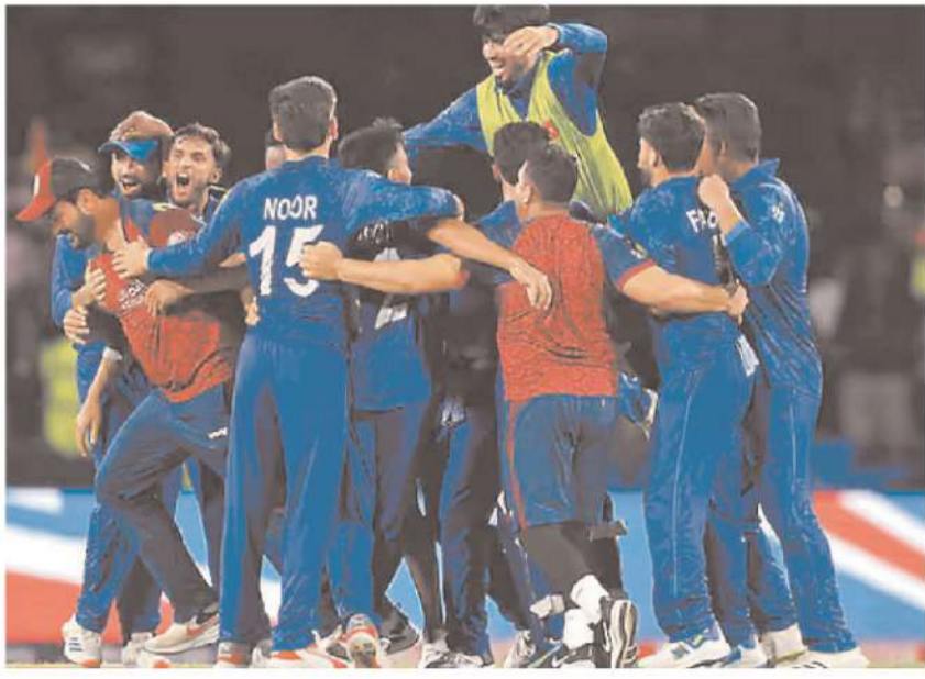
टी-20 वर्ल्डकप: अफगानिस्तान ने किया बड़ा उलटफेर