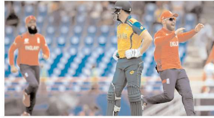
मैच के बाद डेविड मिलर को लेकर मैच अधिकारियों ने रेफरी से इस पूरी घटना को बताया जिसके बाद उन्होंने मिलर को

नई दिल्ली, एजेंसी। साथ अफ्रीका टीम के स्टार बल्लेबाज डेविड मिलर को आईसीसी की फटकार का सामना करना पड़ा है। सेंट लूसिया के डेरें सैमी नेशनल क्रिकेट स्टेडियम में 21 जून अफ्रीका की टीम ने सुपर 8 राउंड में इंग्लैंड के खिलाफ मुकाबला खेला था, जिसमें उन्होंने 7 रनों की करीबी जीत हासिल की। इस मैच में साउथ अफ्रीका की टीम को पहले बल्लेबाजी करने का मौका मिला था जिसमें डेविड मिलर जब बैटिंग कर रहे थे तो उन्होंने एक फैसले पर असहमति जताई थी। इसको लेकर अब आईसीसी की तरफ से मिलर के खिलाफ सख्त कदम भी उठाया गया है। इंग्लैंड और साउथ अफ्रीका के बीच