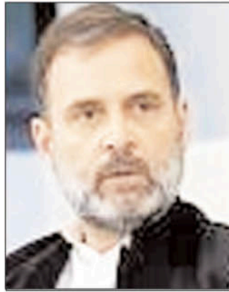
पीएम पद के लिए उम्मीदवार का चयन नतीजों के बाद