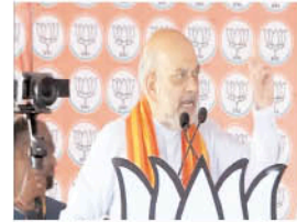
अंबेडकर नगर। केंद्रीय गृहमंत्री अमित शाह ने यूपी के अंबेडकर नगर में एक सार्वजनिक बैठक को संबोधित किया।

इस दौरान उन्होंने कांग्रेस पर धर्म के आधार पर आरक्षण देने का आरोप लगाया। अमित शाह ने कहा कि कांग्रेस पिछड़ों के आरक्षण पर डाका डालने का काम कर रही है। वह उनके हक को गलत तरीके से मुसलमानों को दे रही है। पीएम मोदी ही आपके हक की रक्षा करेंगे। पीएम मोदी ने कहा कि इंडी गठबंधन पिछड़ों के आरक्षण पर डाका डालने का काम करता है। कर्नाटक में बीजेपी गठबंधन ने मुसलमानों को पिछड़ों का 5% आरक्षण दिया है। हैदराबाद में