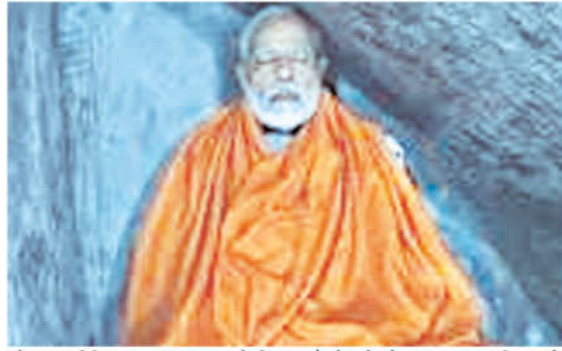
सोशल मीडिया पर वायरल होती हैं।

नई दिल्ली। देश में लोकसभा चुनाव के छह चरण पूरे हो चुके हैं। 1 जून को सातवें चरण के चुनाव होना शेष है। इस बीच, अपने चुनाव अभियान के समापन पर पीएम मोदी 30 मई से 1 जून तक कन्याकुमारी का दौरा करेंगे। पीएम मोदी कन्याकुमारी में रॉक मेमोरियल जाएंगे और 30 मई को शाम से 1 जून की शाम तक ध्यान मंडपम में उसी स्थान पर दिन-रात ध्यान करेंगे, जहां स्वामी विवेकानंद ने ध्यान किया था। मालूम हो कि 2019 लोकसभा चुनाव के दौरान भी अंतिम चरण के मतदान के समय पीएम मोदी ने केदारनाथ का दौरा किया था और वहीं रुद्र गुफा में ध्यान भी किया था। उनका यह दौरा उस समय काफी चर्चा में रहा था और आज भी उनकी ये तस्वीरें