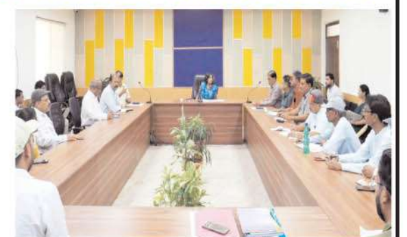
द्वारा भवन अनुज्ञा की प्रगति की जानकारी प्राप्त की। सभी परियोजनाओं को समय सीमा में पूर्ण करने के साथ ही निर्माण कार्यों की गुणवत्ता पर विशेष ध्यान दिये जाने की बात कही। जिससे लापरवाही व शिकायत की स्थिति उत्पन्न न हो। बैठक में कार्यपालन यंत्री श्री राजेश सिंह, श्री एसएल दहावत, श्री एचके

सीधी। निगम आयुक्त संस्कृति जैन द्वारा नगर पालिक निगम के भवन निर्माण अनुज्ञा एवं कालोनी सेल के अधिकारियों कर्मचारियों को बैठक लेते हुये निर्देशित किया है कि नई डवलप हो रही अवैध कालोनियों के रोकथाम हेतु निगम अमले द्वारा टोस कार्यवाही की जाय जिससे इस प्रकार की कालोनियों के विकास न हो। उन्होंने सभी संबंधित अधिकारियों को साफ शब्दों में कहा है कि नई विकसित हो रही अवैध कालोनियों को नोटिस जारी करें, तथा अवैध प्लानिंग में हो रहे निर्माण कार्यों पर कार्यवाही करें। निगमायुक्त द्वारा शहर की विभिन्न परियोजनाओं की प्रगति की समीक्षा की गई एवं पीएमआईएस