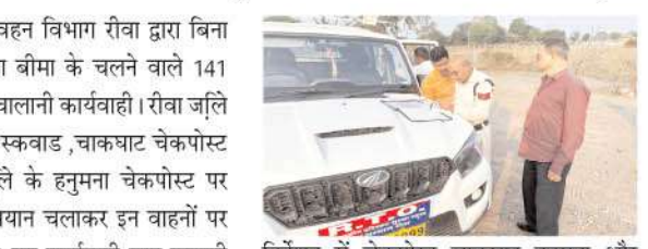
निर्देशन में चेकपोस्ट चाकघाट हनुमना और परिवहन सुरक्षा स्कवाड के प्रभारियों द्वारा की गई जाँच में विशेष रूप से स्पीड गवर्नर लाइट इंडिकेटर बैक लाइट और फिटनेस से संबंधित अन्य मानकों की जांच की गई।

सीधी। परिवहन विभाग सीधी द्वारा बिना फिटनेस और बिना बीमा के चलने वाले 141 वाहनों पर की गई चलानी कार्यवाही। सीधी जिले में परिवहन सुरक्षा स्कवाड, चाकघाट चेकपोस्ट, एवं मऊगंज जिले के हनुमना चेकपोस्ट पर सघन चेकिंग अभियान चलाकर इन वाहनों पर कार्यवाही की गई। यह कार्यवाही माह जनवरी 2024 से मार्च 2024 के बीच की गई। कार्यवाही से 620000 (छै लाख बीस हजार रुपये) का राजस्व शमन शुल्क के रूप में अर्जित किया गया है। यह कार्यवाही सीधी आर टी ओ के