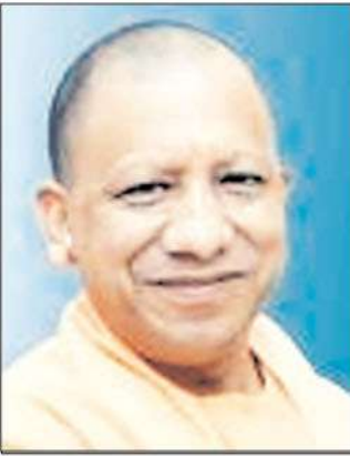
अमेठी में खूब गरजे सीएम योगी