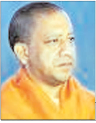
लोकसभा चुनाव में गुंजा योगी मॉडल